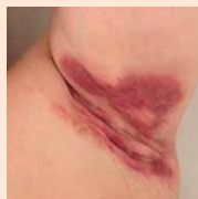
Hautveränderung mit eitrigen Knoten, Flüssigkeitsaustritt und Narben