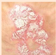
Rote schuppige Hautveränderungen

(Ort der Veränderung bitte oben in der Abbildung markieren und entsprechendes Bild/Foto der Hautveränderung ankreuzen.)