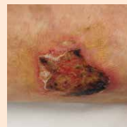
Schmerzhaft tiefe Wunden mit rotblauem Rand