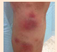
Schmerzhaft rote Knoten

Ist eine solche Wunde schon früher aufgetreten?