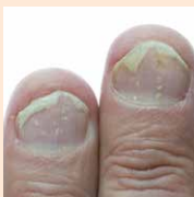
Veränderung von Nagelfarbe und -dicke